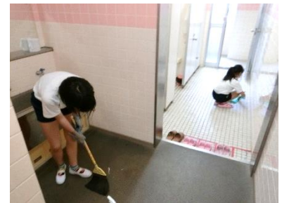
トイレ掃除もしっかりできる中学年

6月12日からプール開きをすることができました。今年度は小プールと大プールに2学級ずつ入ることができるようになりました。始めは不安そうにしていた子供たちも、授業を重ねるにつれて水にも慣れ、「プールが楽しくなってきた」「顔がつけられるようになったよ」「25メートル泳げるようになった」などと、自分の上達ぶりを嬉しそうに話してくれます。小学生の間に、どの子も25～50m以上泳げるようになることを目指して指導をしています。6年生は、水難から命を守ることができるよう、最終日に着衣水泳も行います。1学期いっぱい、熱中症にも十分配慮しながら進めていきます。ご家庭では、水着などの準備をしていただき、ありがとうございました。